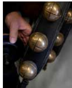
Bjällrorna är gjutna efter äldre modell och ljudet av dem minner om svunna tider.